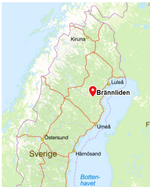
Figur 2: Karta över elnätets geografiska lokalisering.

Figur 2 visar en mer utzoomad bild på området för att ge läsaren en bättre överblick över i vilken del av landet företagets elnät finns.