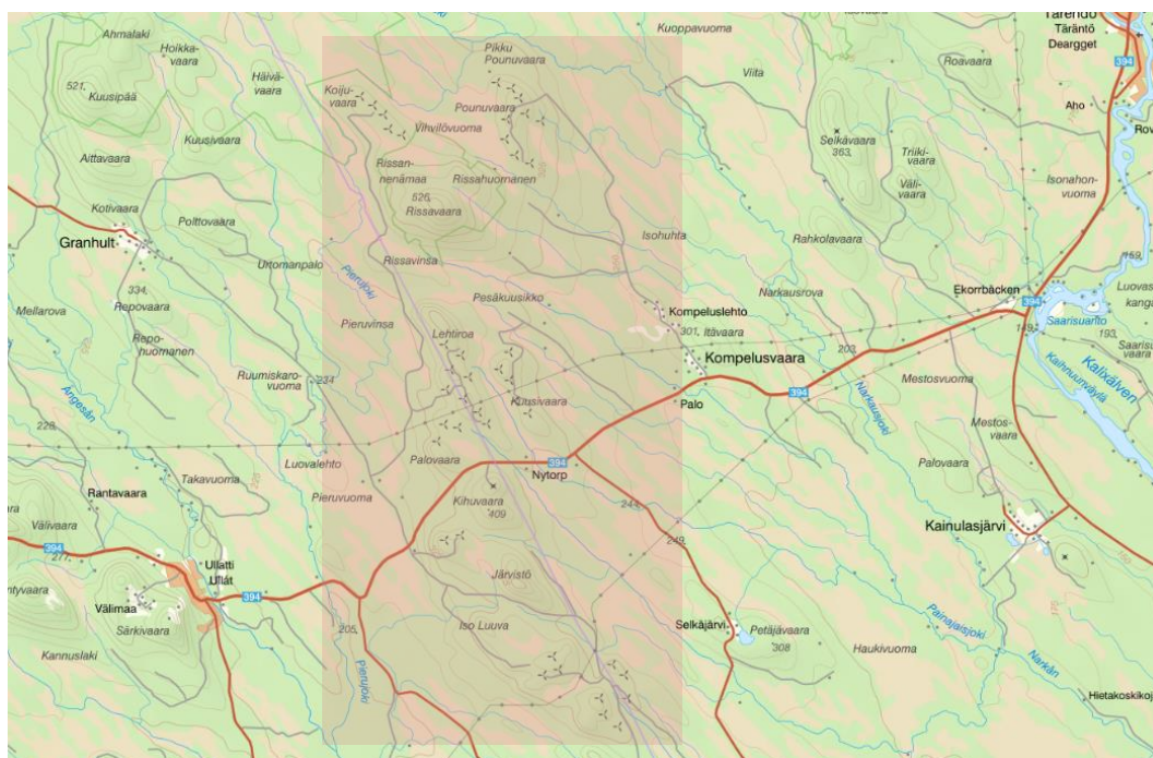
Figur 1 Karta över område där företagens elnät är beläget.

Figur 2 visar en mer utzoomad bild på området för att ge läsaren en bättre överblick över i vilken del av landet företagens elnät finns.