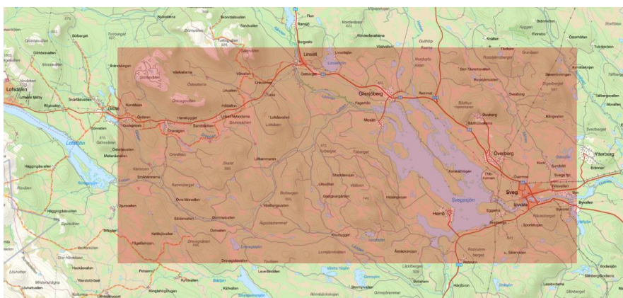
Figur 1: Karta över området där företagets elnät är draget.

Figur 2 visar en mer utzoomad bild på området för att ge läsaren en bättre överblick över i vilken del av landet företagets elnät finns.