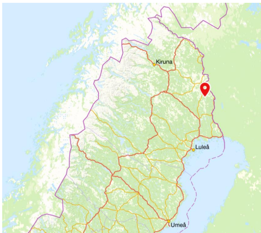
Figur 2: Karta över elnätets geografiska lokalisering.