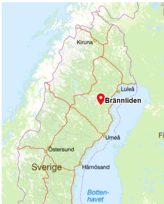
Figur 2: Karta över elnätets geografiska lokalisering.